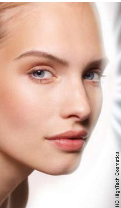
HC HighTech Cosmetics

Formule dermocosmetiche, specialità leviganti, prodotti effetto lifting per un viso e uno sguardo più giovani e luminosi.